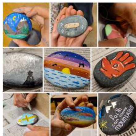
Fotocollage happy stones Teens Group

Matteüs laat het opstandingsverhaal eindigen met een prachtige belofte: 'Ik ben met jullie, alle dagen'. Hoe houden wij die belofte levend? Als je iemand moet missen helpt het om een tastbare herinnering aan diegene te hebben. Een mooi sieraad, een dierbaar voorwerp, een foto. Met een mooi woord heet dat een 'memento'. We gingen creatief aan de slag om een 'memento' te maken voor de opgestane Jezus. Op zogenaamde 'happy stones' schilderden we onze eigen Paasbelofte. De steen die was weggerold werd zo onze herinneringssteen.