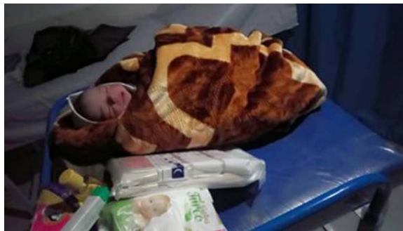
Collecte 18 mei: Stichting Rescue Mother and Child Afghanistan