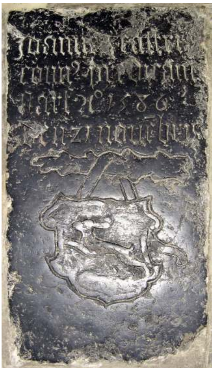
De afbeelding op de Paaskaars is ontleend aan deze kleine grafzerk met onder de tekst een knoestige stok met daaraan een wapenschild met een springende haas.

De consistoriekamer kan beschouwd worden als de 'schatkamer' van de Dorpskerk. Het is de moeite waard daar eens een kijkje te nemen, bijvoorbeeld tijdens de 'Open Kerk' op donderdagmorgen. Gouden en zilveren kerkschatten zijn er niet te zien, wel objecten die een relatie hebben met voornamelijk vroegere gemeenteleden en hun band met hun kerk en geloofsgemeenschap.