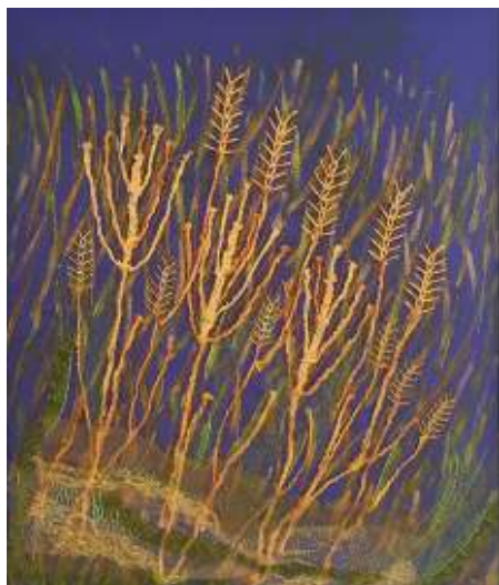
Het brood dat leven geeft. Het graan verwijst naar de graankorrel en de opstanding