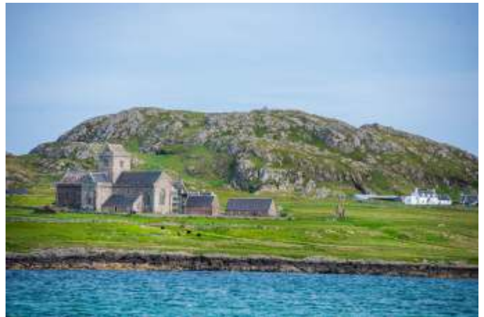
Iona Community. ( www.iona.org.uk .)