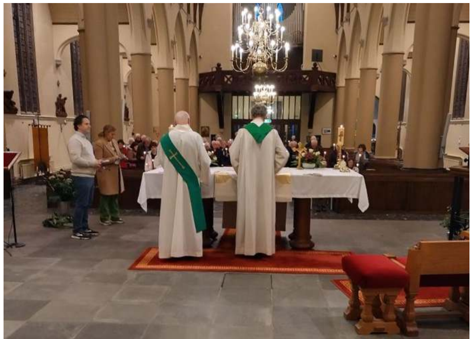
Oecumenisch vesper Pancratiuskerk 24 januari 2025.