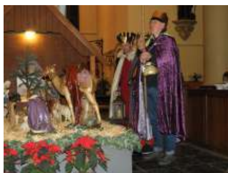
De wijzen in de St. Pancratiuskerk