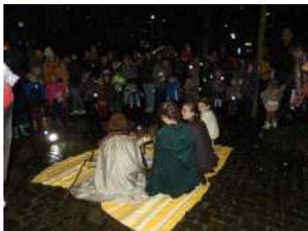
Bij de herders waren de schapen onrustig, ging er iets gebeuren?