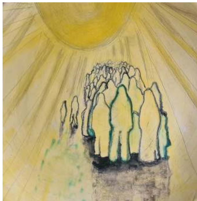
Detail van een handgeschilderd bord uit het St. Liobaklooster, EB