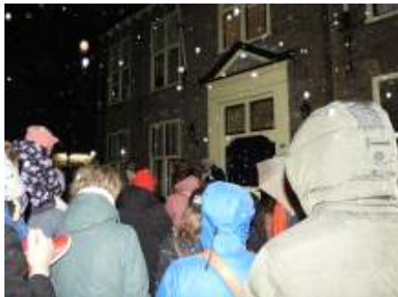
De herbergier verteld dat er geen plaats is in de herberg.