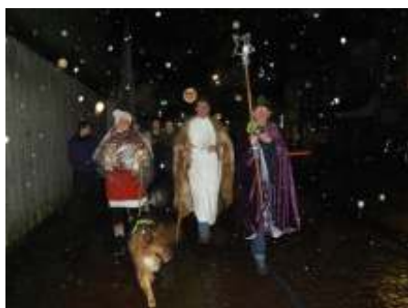
De tocht van de Dorpskerk naar de St Pancratiuskerk