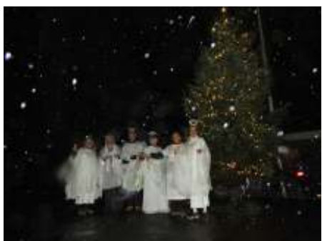
De engelen zingen bij de RK-Parochiekerk