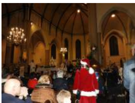
Allen tezamen in de St. Pancratiuskerk