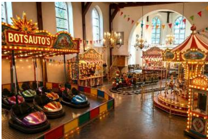
Afbeelding gegenereerd met ChatGPT, op basis van een foto van Rik Willemsen

Ik zit gebogen over een vragenlijst van de organisatie van het jaarlijkse Open Monumentenweekend. Dit jaar probeert de organisatie verschillende monumenten in de regio thematisch aan elkaar te koppelen. Daarvoor is het nodig zo goed mogelijk te weten wat er bij ieder monument te beleven valt, hoe het dagprogramma er uit ziet, of er speciaal iets is voor kinderen en of er bijzonderheden zijn qua toegankelijkheid.