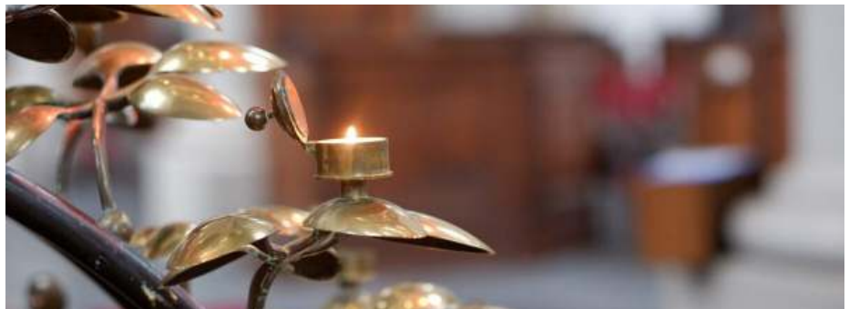
PKN Amsterdam: stilteplek.