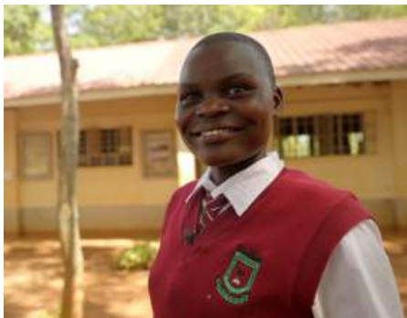
Kenia: Kinderen kunnen stoppen met zwaar werk en krijgen de kans om naar school te gaan

In afgelegen dorpen in Kenia volgt 1 op de 8 kinderen geen onderwijs. Kinderen moeten werken in de visserij, in mijnen, op plantages of huishoudelijk werk verrichten. Een Keniaanse organisatie spoort kinderen op die niet naar school gaan om te proberen werkende kinderen weer naar school te laten gaan. Sociaal werkers leggen contact met hun ouders en zoeken samen met hen naar oplossingen, zodat kinderen wel school kunnen. Ouders worden bewust van het belang van onderwijs en krijgen hulp om genoeg te verdienen om schoolkosten te betalen. Kerk in actie ondersteunt dit belangrijke werk met van uw giff.