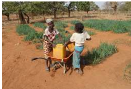
Stichting WOL: schooltuinen bij scholen met ontheemde leerlingen

Burkina Faso; Armoede, analfabetisme en onwetendheid gaan hand in hand. Landen die arm zijn, hebben geen geld om een goed onderwijssysteem op te zetten. Zonder onderwijs blijft de bevolking ongeschoold en onwetend. Onwetende mensen zien geen mogelijkheden om uit de armoede te ontsnappen.