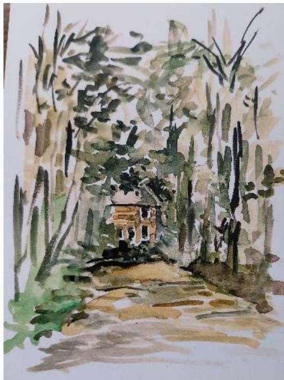
Zicht op: “Hof van Kijk Uit”