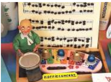
Etalage van een drogist aan de Westerstraat in Amsterdam