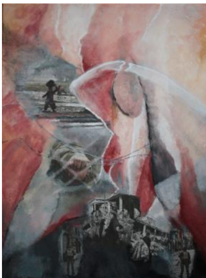
“Maak heel wat is gebroken”